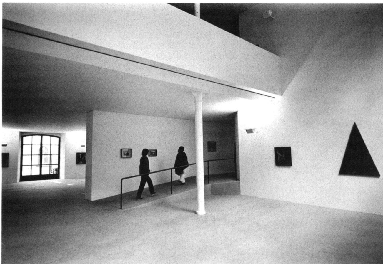
3 Espace intérieur du Musée d'art contemporain de Bâle.

S'il est dans la nature du musée de produire des effets pervers, on se demande alors s'il ne vaudrait pas mieux assumer ceux-ci, les accuser même, en jouer pour ne pas en devenir les jouets? Paradoxalement, le temps peut être un allié précieux dans cette entreprise d'exorcisme: il finit par faire ressortir des significations captieuses qui avaient commencé par agir clandestinement, il déprend donc le regard des leurre idéologiques. Le fait est que les musées se bonifient avec les années: leurs connotations religieuses, moralisantes, civiques, patriotiques, etc., se déposent comme du tanin, elles perdent leur nocivité, elles prennent en revanche une saveur poétique un peu surannée, comme les peintures académiques. Les anciens musées finissent par se muséifier eux-mêmes au second degré, en nous protégeant homéopathiquement contre leurs propres effets. La distanciation du regard ainsi réalisée nous entraîne à relativiser généalogiquement le discours muséal et à voir les objets dans leur relief historique.