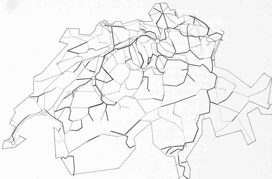
Bild 2. Veränderungen der Emissionsmengen auf einzelnen Streckenabschnitten zwischen 1970 und 1975. Dicke Linien: Zunahme über 40%. Dünne Linien: 1 bis 40%. Gestrichelte Linien: Abnahme oder gleich geblieben

der Gesamtemissionen wird durch die Zunahme des Verkehrsaufkommens während mehreren Jahren bei weitem aufgehoben.