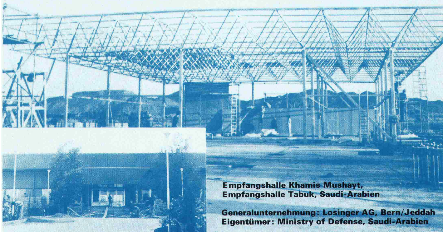
Empfangshalle Khamis Mushayt, Empfangshalle Tabuk, Saudi-Arabien

Monbijoustrasse 16 Telex 33260 mapa ch, Tel. 031 25 43 55/56