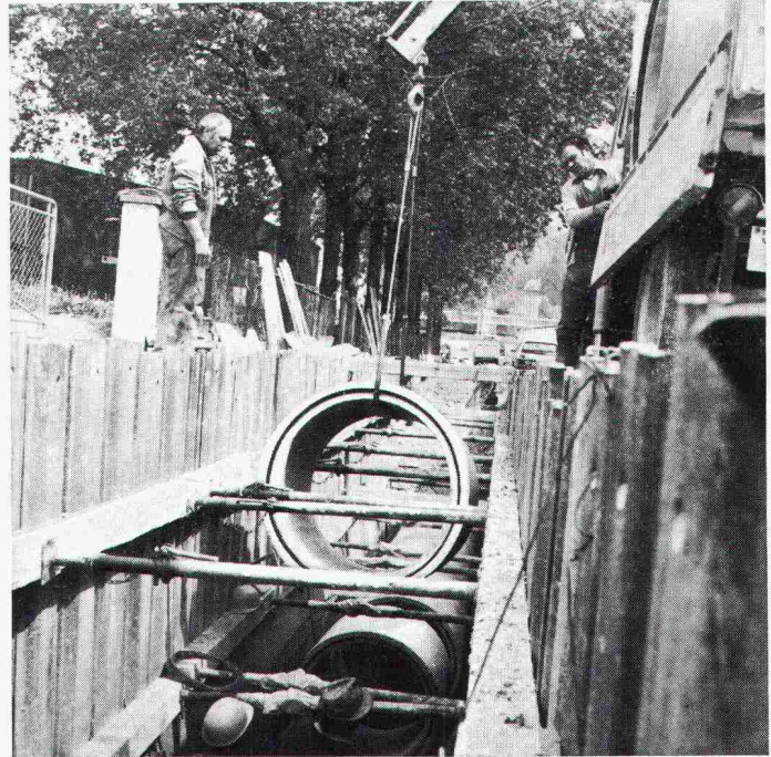
Abladen und Einsetzen von Betonröhren mit einmontierten «BFL-Mastix»-Bändern