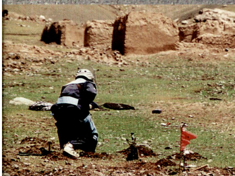
Minen und Blindgänger sind auch ein Hindernis für den Wiederaufbau.