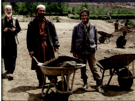
Arbeiter am Wiederaufbau im Garten des Baburs in Kabul.