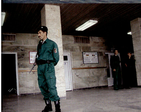
Flughafen Kabul: Sicherheit.