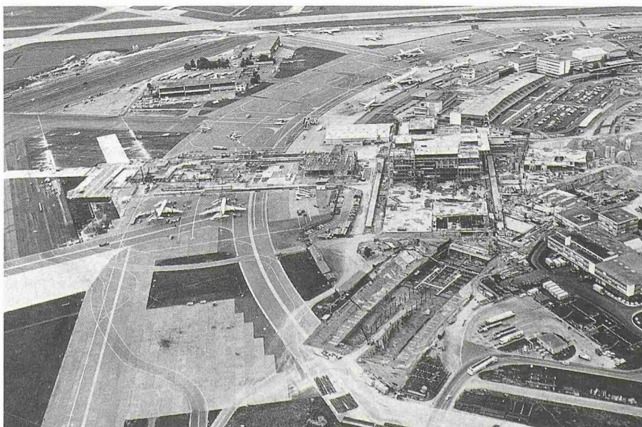
Bild 2. 1973 glich der Flughafen während der dritten Ausbauetappe einer riesigen Baustelle. Terminal, Findexdock und Parkhaus B wachsen empor, die Baugrube der SBB-Flughafenlinie (im Vordergrund) liegt noch offen da