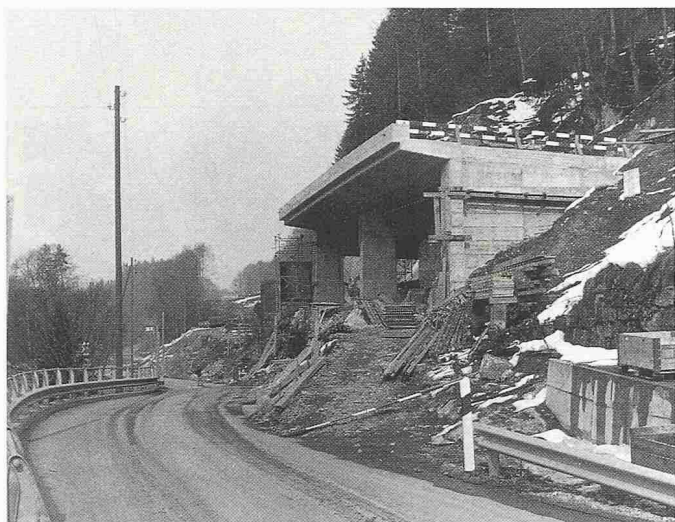
Bau einer Lehnenkonstruktion in Iseltwald-Sengg, 1985

Felssicherungsarbeiten oberhalb von Iseltwald. Links unten knapp sichtbar die N8 und das Westportal Chüebalm-Tunnel. 1987