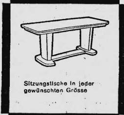
Sitzungsische in jeder gewünschten Grösse

Facit-Vertrieb AG Zürich 1 Selnaustrasse 6 Tel. 051/27 58 14