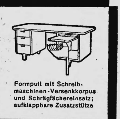
Formpult mit Schreibmaschinen-Versenkkorpus und Schrägfächerersatz; aufklappbare Zusatzstütze