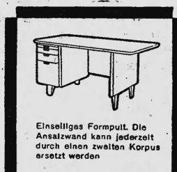
Einselliges Formpult. Die Anschlagwand kann jederzeit durch einen zeitlosen Korpus ersetzt werden

Das Formpult unterscheidet sich von den früher gebräuchlichen Pulten und Schreibtischen durch vollständig neue Linienführung, verbunden mit zeitloser Eleganz und grösster Zweckmässigkeit. Es ist nach einem Spezialverfahren - Hochfrequenzverleimung und Formpressung - hergestellt und hat so ein um 25% geringeres