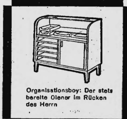
Organisationsboy: Der stets bereite Olenar im Rücken des Herrn

Wichtig! Kennen Sie schon unseren Büromöbel-Service? Unsere Schreiner stehen Ihnen für Reparaturen jederzeit zur Verfügung!