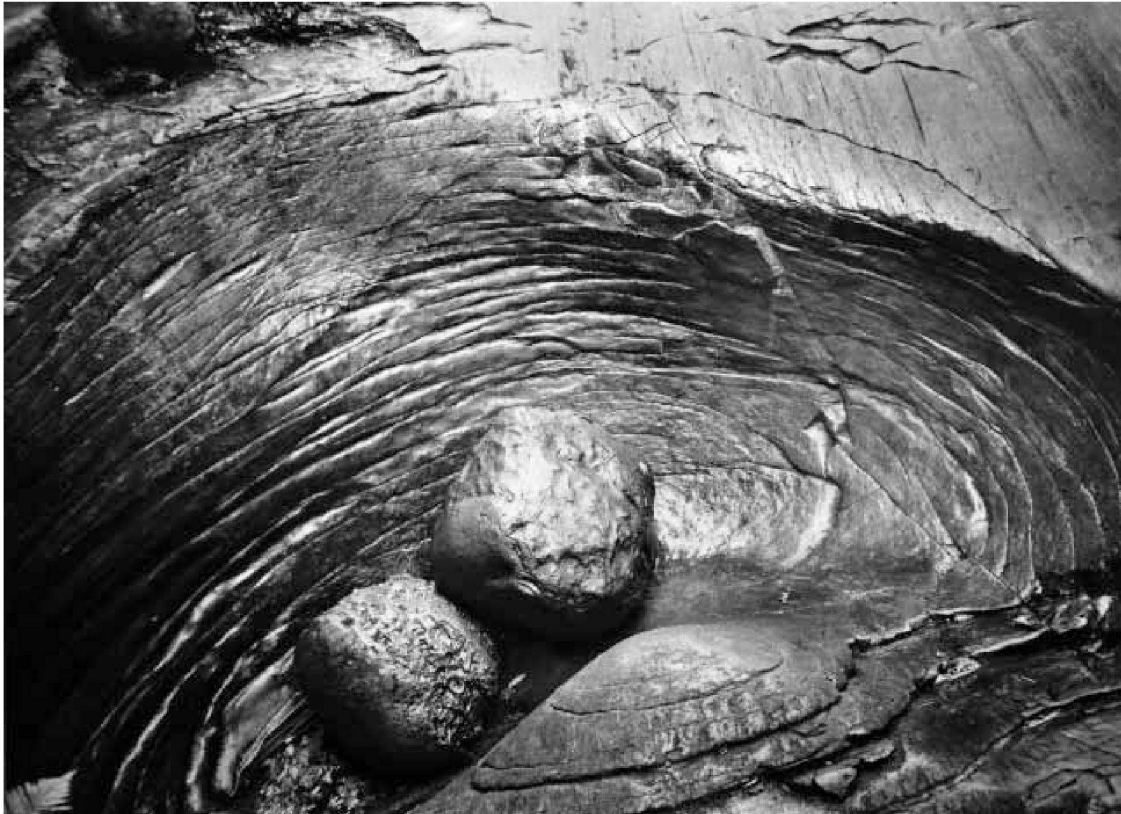
Gletschertopf mit zwei Findlingen, nach 1930 (Photoglob No. A. 2336)