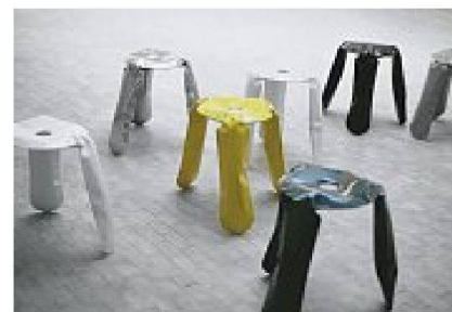
Hocker «Plopp», Design: Oskar Zieta für HAY

dies alles zu erfüllen. So suggeriert die Formensprache vertraute Zeitlosigkeit. Die Materialien vermitteln in ihrer hochwertigen handwerklichen Verarbeitung Langlebigkeit. Als dauerhaft nehmen wir sie auch wahr, weil sowohl Beton wie Formsperrholz bewährte Qualitätskonstanten in der Geschichte des Möbeldesigns und in der Architektur sind. Das einfache Konstruktionsprinzip kommuniziert zudem, dass sich die einzelnen Elemente einfach voneinander lösen, bei Bedarf ersetzen oder gegebenenfalls separat dem Recycling zuführen lassen. Die Problematik des Designs in Bezug auf Nachhaltigkeit, wie von Konstantin Grcic angeführt, liegt in einer Komponente, die das Design an sich nicht unter Kontrolle hat. Erst der Faktor Zeit kann das Versprechen einlösen, ob das Design als solches zeitlos und langlebig ist. Es erstaunt nicht, dass viele Möbeldesigner im Ent-