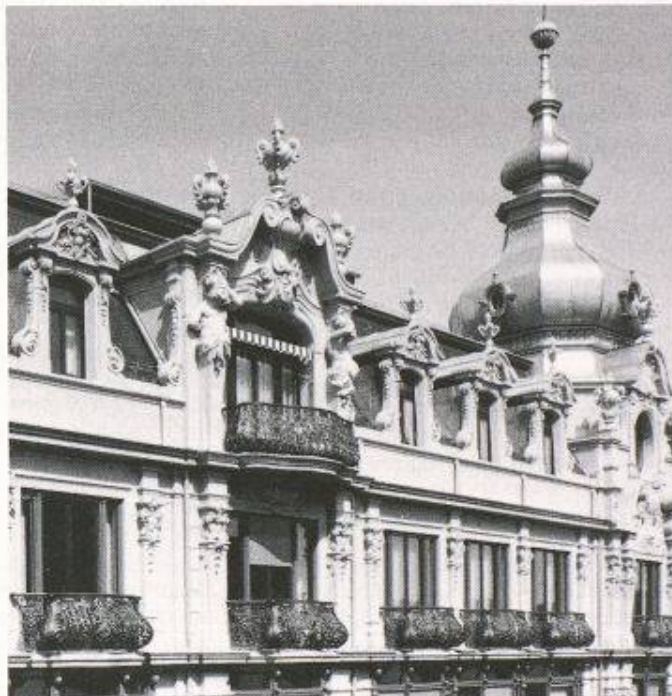
Die ursprünglichen Gussgeländer der Balkone wurden anhand von Fotografien aus der Jahrhundertwende in Aluguss rekonstruiert

Für die Sanierung und Rekonstruktion des Geschäftshauses «Metropol», erbaut im Jahr 1895, verlieh die Pro Re-