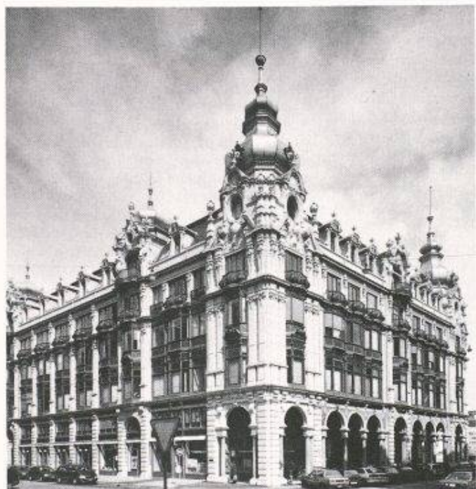
Die Stadt Zürich erhielt von der Pro Renova das «Goldene Dach» als Auszeichnung für die vorbildliche Renovation des Geschäftshauses «Metropol»