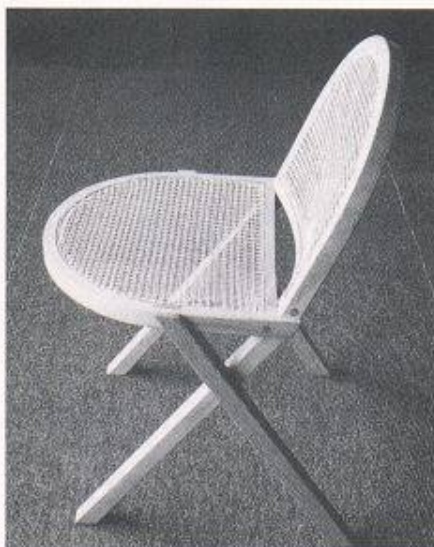
Stuhl, 1955. Ausgeführt in naturfarbigem Avodire-Holz und Juncgeflecht. Sitz und Rückenpartie in Form und Grösse gleich

Der Band enthält die von Werner Blaser selbst präsentierten Arbeiten in themati-