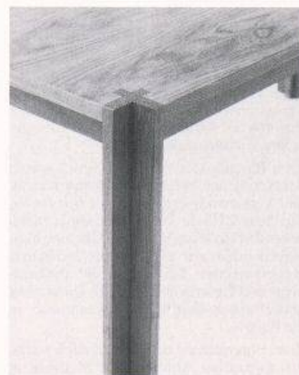
Kreuzelement für horizontale oder vertikale Lage. Der Rahmenbau verlangt Formgleichheit der Füge-teile, um die maschinelle Erstellung zu ermöglichen