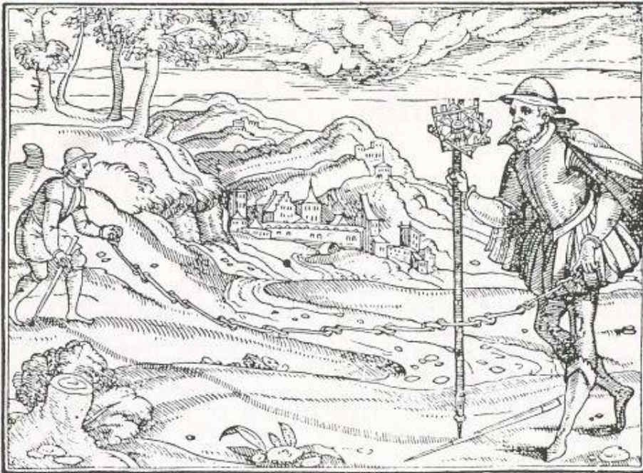
Bild 1: Landmesser mit Kreuzvisier und Messkette (In: C. Stephan, J. Liebhalt: «Von dem Feldbau», 1579)

Die folgenden Zitate mögen dazu einen kleinen Einblick geben: