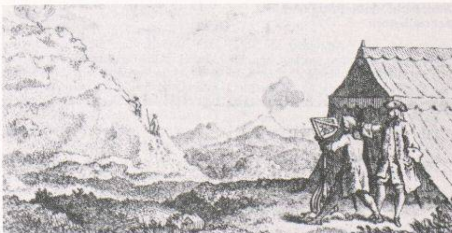
Bild 3: C. M. La Condamine: Triangulation im Hochgebirge von Peru (In: «Mesure des trois premiers degrés du Méridien dans l'hémisphère Australe», 1751)

Die Arbeitsmethoden und die Arbeitsbedingungen haben sich geändert, seit-