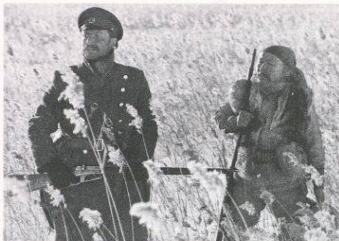
Bild 4. Szenenbild aus dem Film «Dersu Usala» von Akira Kurosawa (Japan/UdSSR 1975)

dem Wladimir Arsenjew in den Jahren 1902–1907 seine Expeditionen im Auftrag der Russischen Geographischen Gesellschaft unternahm. Die Kenntnisse von diesem rauhen, unwegsamen Land waren anfangs des 20. Jahrhunderts noch lückenhaft. Die Taiga war nur an ihren Rändern besiedelt; nur einzelne Punkte waren von der Küste erforscht und kartographisch aufgenommen worden. 1902 hatte Arsenjew den Taigajäger Dersu Usala kennengelernt und mit ihm Freundschaft geschlossen. Dieser begleitete seither Arsenjew auf seinen Expeditionen. Dersu verkörpert eine archaische Kultur, die mit der Natur in einem für uns seltsamen Verhältnis der Direktheit steht. Arsenjews Schilderungen vereinigen Wissenschaftlichkeit und dichterische Darstellungskraft. Gorki erkannte das poetische Genie Arsenjews. Der japanische Filmregisseur Kurosawa verfilmte das Buch 1975.