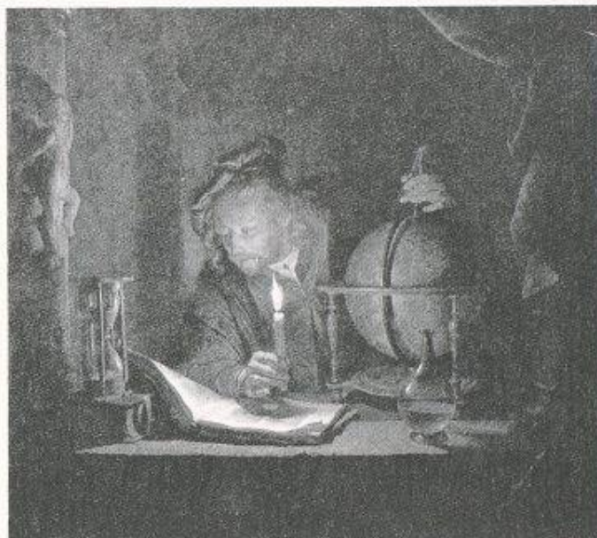
Bild 2: Gerard Dou: «Der Astronom bei Kerzenlicht» um 1650/55 (Titelbild zu Marguerite Yourcenar: Die schwarze Flamme)

Dorfbürgermeister, von ihrer neuen Funktion heftig Gebrauch machend, entziffern mühselig die offiziellen Dokumente oder verweigern die Mitarbeit gleich ganz und gar. Die Signalpunkte für die geodätischen Messungen werden zerstört, die Handwerker sind oft im Krieg gefallen.