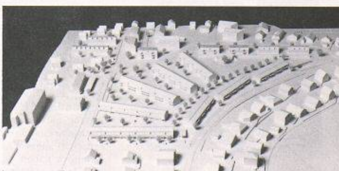
Wohnsiedlung Herdswand, Emmenbrücke, 1. Preis