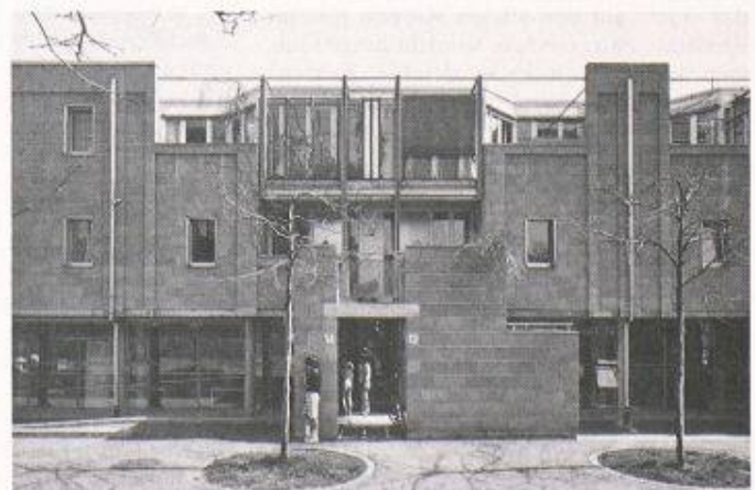
Besondere Erwähnung: ABB-Arbeitsgruppe, Bern, Siedlung Merzenacker, Bern