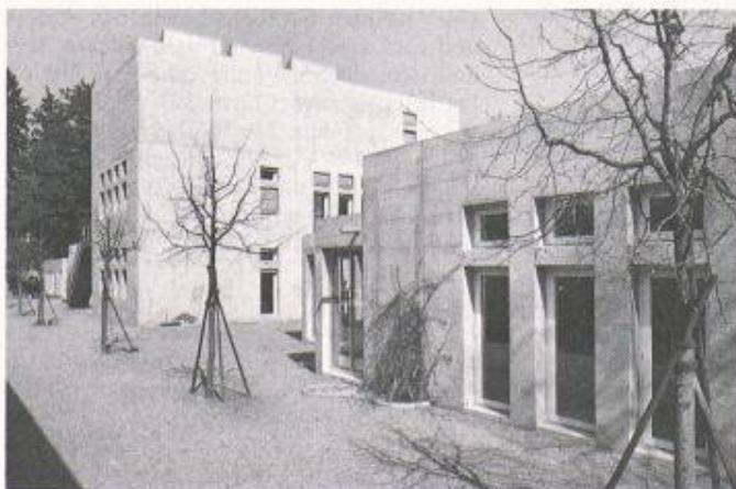
Preisträger des letzten Architekturpreises Beton 1989: Atelier 5, Bern, staatliches Lehrerseminar Thun

Die nachstehend aufgeführten Dokumente sollen spätestens bis zum 26. Februar 1993 (Poststempel) an die Technische Forschungs- und Beratungsstelle der Schweizerischen Zement-, Kalk- und Gips-Fabrikanten (VSZKGF) in Zofingen eingereicht werden.