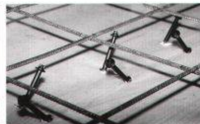
SFS-Verbund-Elemente verbessern das Tragverhalten