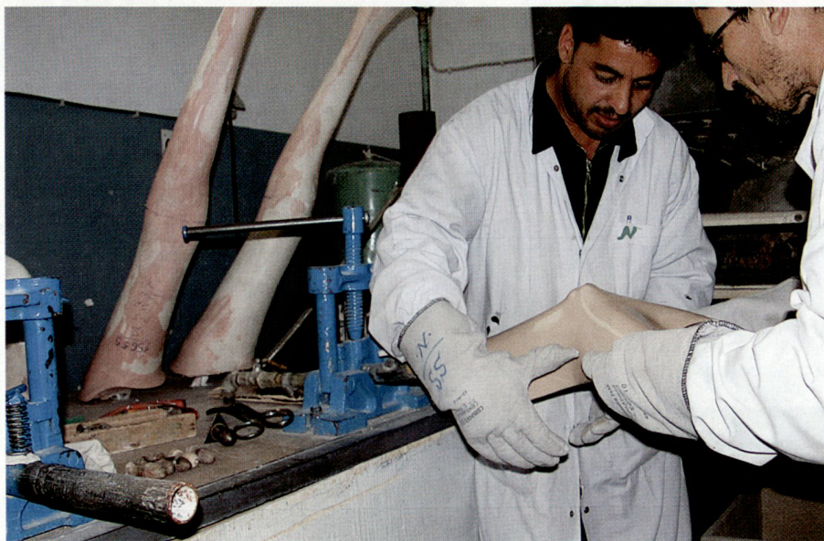
Aus Hartplastik wird eine neue Prothese hergestellt.

hinaus grosse Beachtung. Bedauerlicherweise finden sich nur wenige vergleichbare Projekte ausländischer Hilfsorganisationen, die ebenso auf Nachhaltigkeit, Zweckmässigkeit und zielgerichtet auf die Bedürfnisse dieser leidgeplagten Nation ausgerichtet sind.