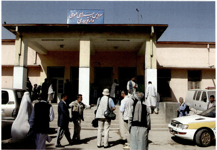
Eingang des Zentralspitals von Mazar-e-Sharif.