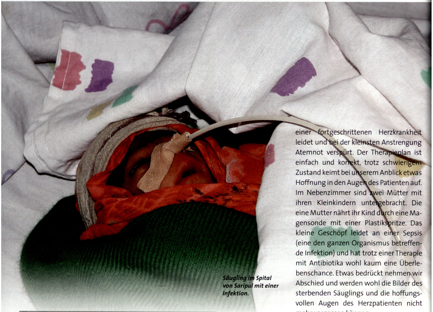
Säugling im Spital von Saripul mit einer Infektion.

einer fortgeschrittenen Herzkrankheit leidet und bei der kleinsten Anstrengung Atemnot verspürt. Der Therapienplan ist einfach und korrekt, trotz schwierigem Zustand keimt bei unserem Anblick etwas Hoffnung in den Augen des Patienten auf. Im Nebenzimmer sind zwei Mütter mit ihren Kleinkindern untergebracht. Die eine Mutter nährt ihr Kind durch eine Magensonde mit einer Plastikspritze. Das kleine Geschöpf leidet an einer Sepsis (eine den ganzen Organismus betreffende Infektion) und hat trotz einer Therapie mit Antibiotika wohl kaum eine Überlebenschance. Etwas bedrückt nehmen wir Abschied und werden wohl die Bilder des sterbenden Säuglings und die hoffnungsvollen Augen des Herzpatienten nicht mehr vergessen können.