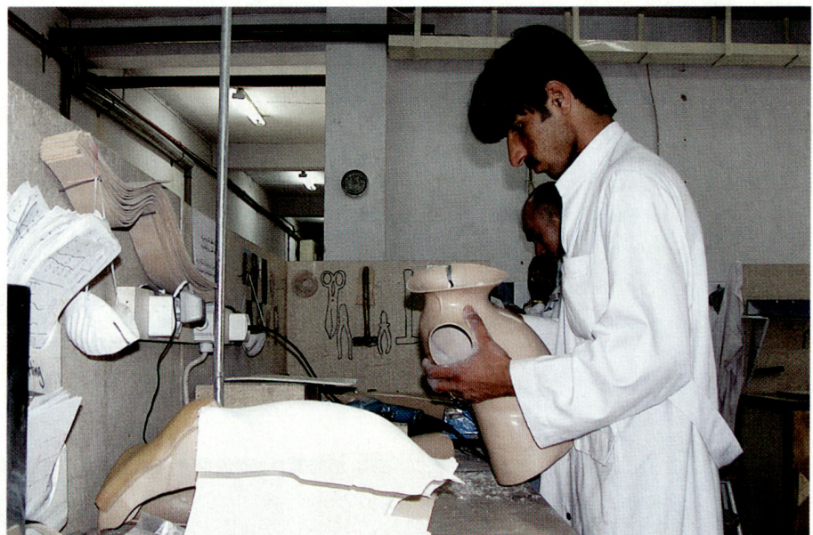
Ein Thorax-Korsett für ein Kind entsteht.

Nicht nur für die unmittelbare Behandlung ist gesorgt. Es werden auch grösste Anstrengungen unternommen, diese Menschen so rasch wie möglich als gleichwertige Mitglieder wieder in die Gesellschaft und den Arbeitsprozess einzugliedern. Dies geschieht mittels Arbeitsvermittlung, Schulausbildung für Kinder und Vergabe von Kleinkrediten an zukünftige Kleinunternehmer. Mehr als 7000 ehemalige Patienten haben diese Chance zur Unabhängigkeit und Selbstständigkeit in Anspruch genommen. Solche vorbildliche Projekte wie die orthopädischen IKRK-Zentren in Afghanistan haben auch für Projekte ausserhalb des Gesundheitswesens Modellcharakter und finden weit über die Landesgrenzen