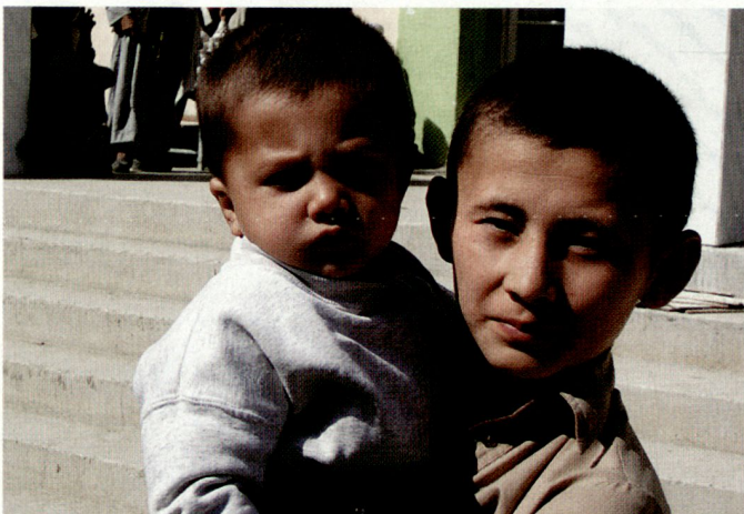
Afghanischer Knabe mit seinem kleinen Bruder vor dem Spital in Mazar-e-Sharif.

Bei jedem Besuch in Afghanistan stellt sich die Frage, was zu tun ist. Dass auch Hilfe nicht immer unproblematisch sein kann, zeigt sich in der konfliktbehafteten Situation zwischen der Regierung und den Hilfsorganisationen, die durch ihre finanziellen Möglichkeiten beinahe alle qualifizierten Kräfte aufsaugen und beträchtliche Spannungen provozieren. Um nicht den durchaus positiven Beitrag dieser Organisationen zu schmälern, wäre sicher die ordnende Hand einer starken Regierung notwendig. Weitere Schwerpunkte müssten neben dem Ausbau der Infrastruktur in der Ausbildung von Fachpersonal liegen. Der Ausbildungsstand der Ärzte ist – nach Auskunft eines englischen Arztes, der seit Jahren in Kabul junge Kollegen weiterbildet – nicht gut. Auch die Afghanen selber bemängeln diesen Umstand immer wieder. Einige funktionstüchtige Spitäler und Institutionen sind meist nur durch vor Ort tätige Kollegen und Kolleginnen aus dem Ausland entstanden, was allerdings gut investierte Hilfe ist, da dadurch ein permanenter Wissenstransfer stattfindet.