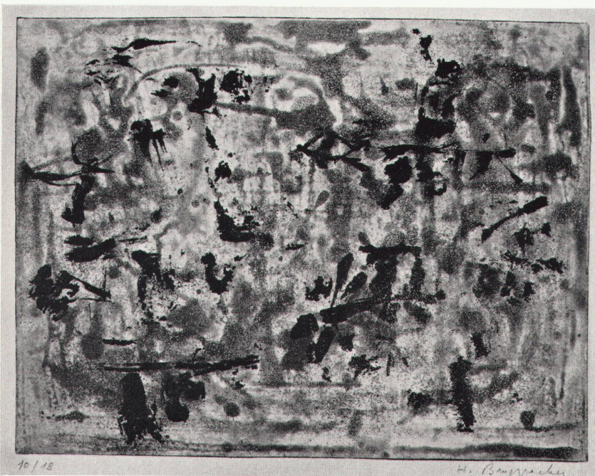
6 Heinrich Bruppacher, Schwarze Zeichen auf bewegtem Grund, 1964 Signes noirs sur fond mouvementé. Aquatinte Black signs on animated ground. Aquatint