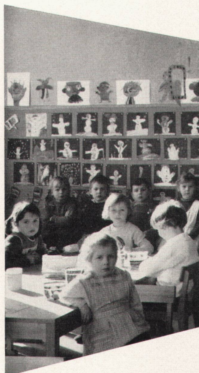
Mobiliar für Kindergärten

mit der 10-Jahres-Garantie für dauerhaften Schreibbelag und den Vorteilen: Angenehmes, weiches, blendungsfreies Schreiben und Zeichnen auf graugrün und schattenschwarzen, magnethaftenden und kratzfesten Flächen, die leicht zu reinigen sind.