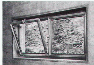
elemente in der Schalung. Resultat: problemloser und kostengünstiger Einbau ohne Anpassungsarbeiten.