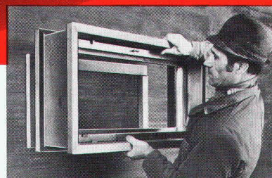
Das geringe Gewicht erlaubt ein müheloses

+ Lieferung durch den Baumaterial-Fachhandel.