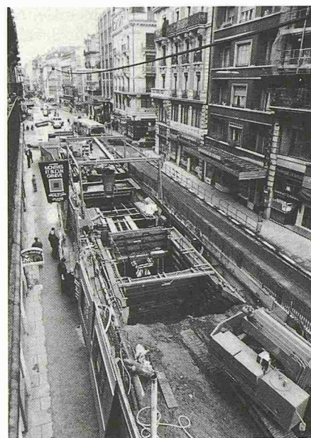
Bild 4. Bau eines Leitungskanals in einer Geschäftshauptstrasse unter Aufrechterhaltung des öffentlichen Verkehrs und Gewährung des freien Zugangs zu den Geschäftseingängen

... Der Staat möge sich weiterhin der Lehre und Grundlagenforschung an den Hochschulen annehmen und die produktorientierte Forschung der Industrie überlassen... Es wäre unseres Erachtens verfehlt, wenn sich der Staat in der angewandten Forschung engagieren würde...»