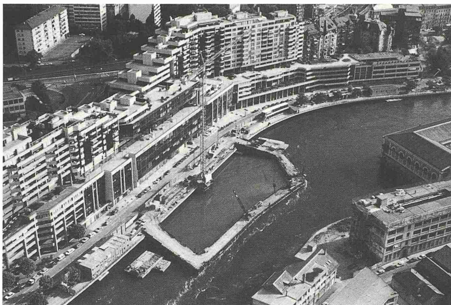
Bild 3. Bau des neuen Regulierwehres in der Rhone in Genf

Der Bauingenieur ETH muss sich durch seine Allgemeinbildung und sein umfassendes Fachwissen auszeichnen, die es ihm ermöglichen, Gesamtzusammenhänge zu erfassen, komplexe Probleme zu lösen und in unvorhergesehenen Situationen richtig zu handeln.