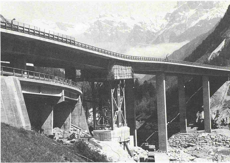
Bild 1. Reparatur des Schadens einer Autobahnbrücke, der durch die Unterspülung eines Pfeilerfundamentes durch Hochwasser entstanden ist

Die Folgen sind oft konstruktive Fehlkonzepte, die rasch zu Bauschäden führen, oder Lösungen, die unverhältnismässig teuer sind.