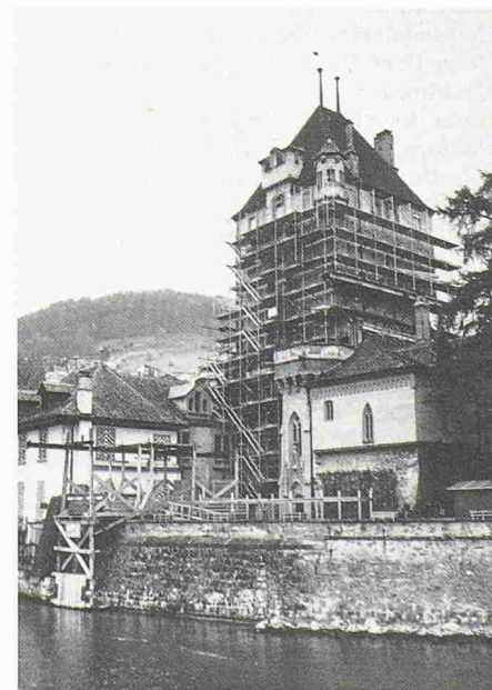
Schloss Oberhofen am Thunersee: Renovation (Bild: Comet)

(Comet) Seit Anfang Mai steht der Bergfried von Schloss Oberhofen am Thunersee unter Renovation. Man rechnet drei bis vier Jahre für die Wiederherrichtung des Turmes. Neben den vielseitigen Aussenarbeiten wird auch das neugotische Inventar aus den Jahren 1851/1852 erneuert. Die Kosten von 2,7 Millionen Franken trägt die Stiftung Schloss Oberhofen.