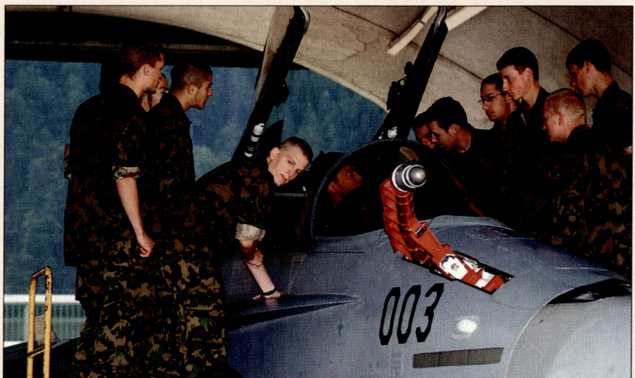
Teilnehmer Of LG 1-05 am LW-Ausbildungstag.

Der in Europa klar erkennbare Trend, dass aus finanziellen Gründen kein Staat mehr alleine eine hochtechnische, teure Luftwaffe betreiben kann und daher die multinationale Zusammenarbeit mit befreundeten Staaten gesucht wird, zwingt uns, die noch bei vielen Schweizern unbe-