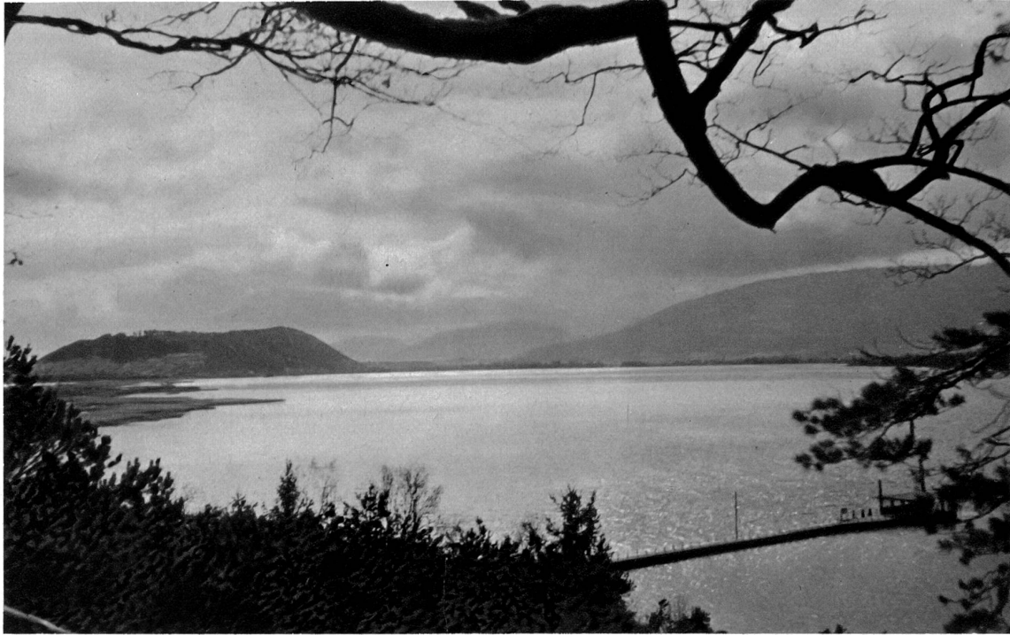
Blick gegen Jolimont-Erlach

In einer verschwiegenen, tiefen Bucht, wo wir den großen Standhecht wieder ausgemacht haben, versenken wir leise den Ankerstein und machen nun die Spinnrute fertig. Die geklöppelte Seidenschnur wird auch dieses Mal ihre Haltbarkeit beweisen. Wir ziehen sie durch die Laufringe der Rute, hängen Blei, Stahlseidenvorschlag und einen künstlichen Fisch ein und tasten mit leichten Würfen die Ranten der Wasserpflanzen ab. Aber es rührt sich nichts, unsere Verführungskünste sind vergebens. Die Würfe werden weiter, führen den Köder durch die Tiefe, systematisch kämmer wir das Wasser Meter für Meter ab, denn wir sind unserer Sache sicher, irgendwo hier unten muß sich mein wehrhafter Gegner herumtreiben. Anscheinend aber ist sein Appetit schon gestillt oder noch nicht rege, und kein noch so kunstvolles Spinnen kann ihn aus seiner Lethargie wecken. Stunden sind bereits vergangen, alle Hoffnung auf Erfolg will zerflattern, der Hecht beißt nicht.