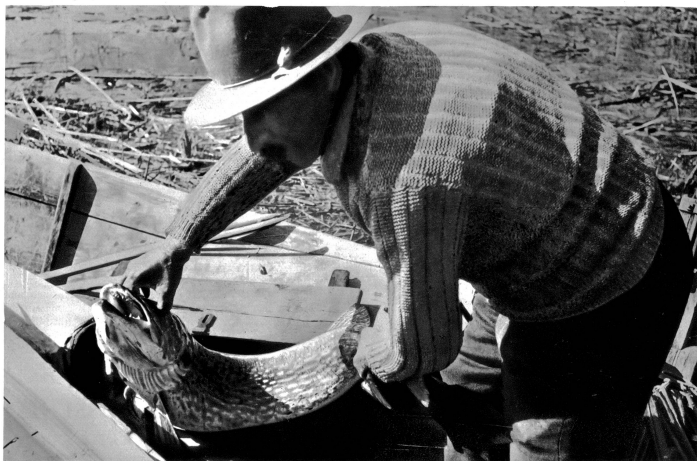
Der Hecht wird herausgenommen und in den Behälter gebracht