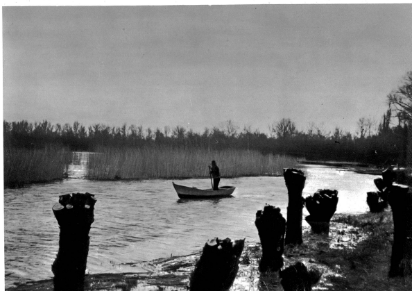
In den „Zügen“. Untiefen im See

Immengen von Barschen, Schleien, Forellen führen hier ihren Kampf ums Dasein, bis der Mensch sie ihrem Element mit Gewalt oder List entreißt. Mein Freund ist der große Hecht, der wehrhafte Ritter dieser Seen, dem sich hier alles Leben beugen muß. Ihm gilt meine Kampfanlage, denn er ist beschlagen und launisch. Es ist gewiß nicht allzuschwer, an guten Tagen, an denen die Hechte wie toll rauben, eine Anzahl kleinerer zu erbeuten — die alten Herren jedoch, die durch trübe