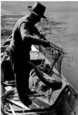
Ein guter Fang, 15 Pfund