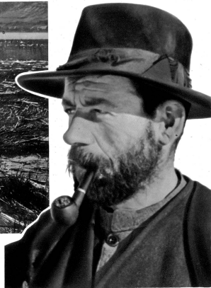
Fischertyp am See

Immengen von Barschen, Schleien, Forellen führen hier ihren Kampf ums Dasein, bis der Mensch sie ihrem Element mit Gewalt oder List entreißt. Mein Freund ist der große Hecht, der wehrhafte Ritter dieser Seen, dem sich hier alles Leben beugen muß. Ihm gilt meine Kampfanlage, denn er ist beschlagen und launisch. Es ist gewiß nicht allzuschwer, an guten Tagen, an denen die Hechte wie toll rauben, eine Anzahl kleinerer zu erbeuten — die alten Herren jedoch, die durch trübe