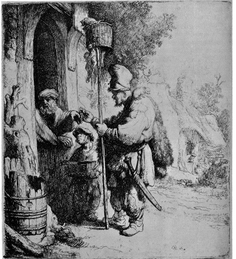
Rembrandt. Der Rattengifthändler. Nach einer Reproduktion aus der Kunsthandlung Hiller-Mathys