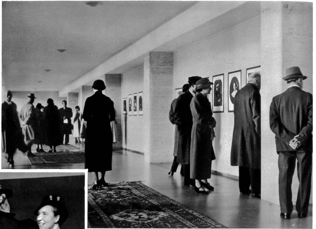
Zahlreiches Publikum in den Räumen der Ausstellung während der Eröffnung