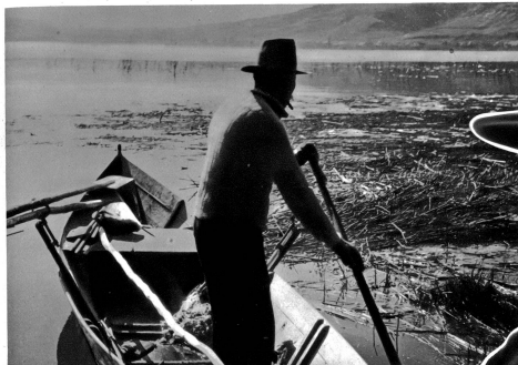
In diesen Untiefen Wasser zieht der Hecht

Unsere Juraesen, — Bieler, Rurten- und Neuenburgersee bergen in ihrem Schoße reiches Leben, mächtige Hechte neben