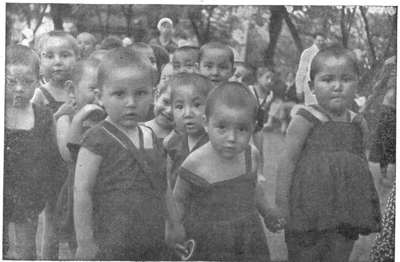
Astrachan: Kalmücken-Kindergarten beim Spaziergang in einem öffentlichen Park.

Aber es drängen ihn Beobachtungen zu Vergleichen, über Einrichtungen, die auch bei uns noch ungelöste Fragen sind. So etwa die Kinderkrippen. Sie sind im neuen Rußland eine allgemein verbreitete Einrichtung; sie gehören zu jeder Fabrik, man trifft sie in jedem Dorf. Am Vormittag um 9 Uhr bringt die werktätige Mutter ihre Kinder in die Krippe. Hier sind sie in geschulter Pflege bis nachmittags 5 Uhr, da die Mutter sie wieder abholt. Sie werden gewaschen, nach ihrem Gesundheitszustand von einem Kinderarzt untersucht, gespeist und