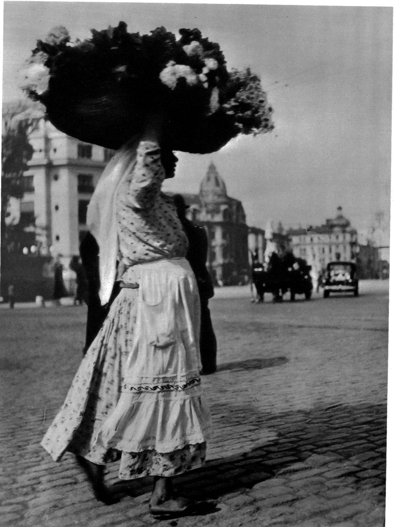
Gegen 200 Blumenverkäuferinnen finden ihren Verdienst durch Blumenverkauf in den Strassen von Bukarest, welche auch die Stadt der Rosen genannt wird.