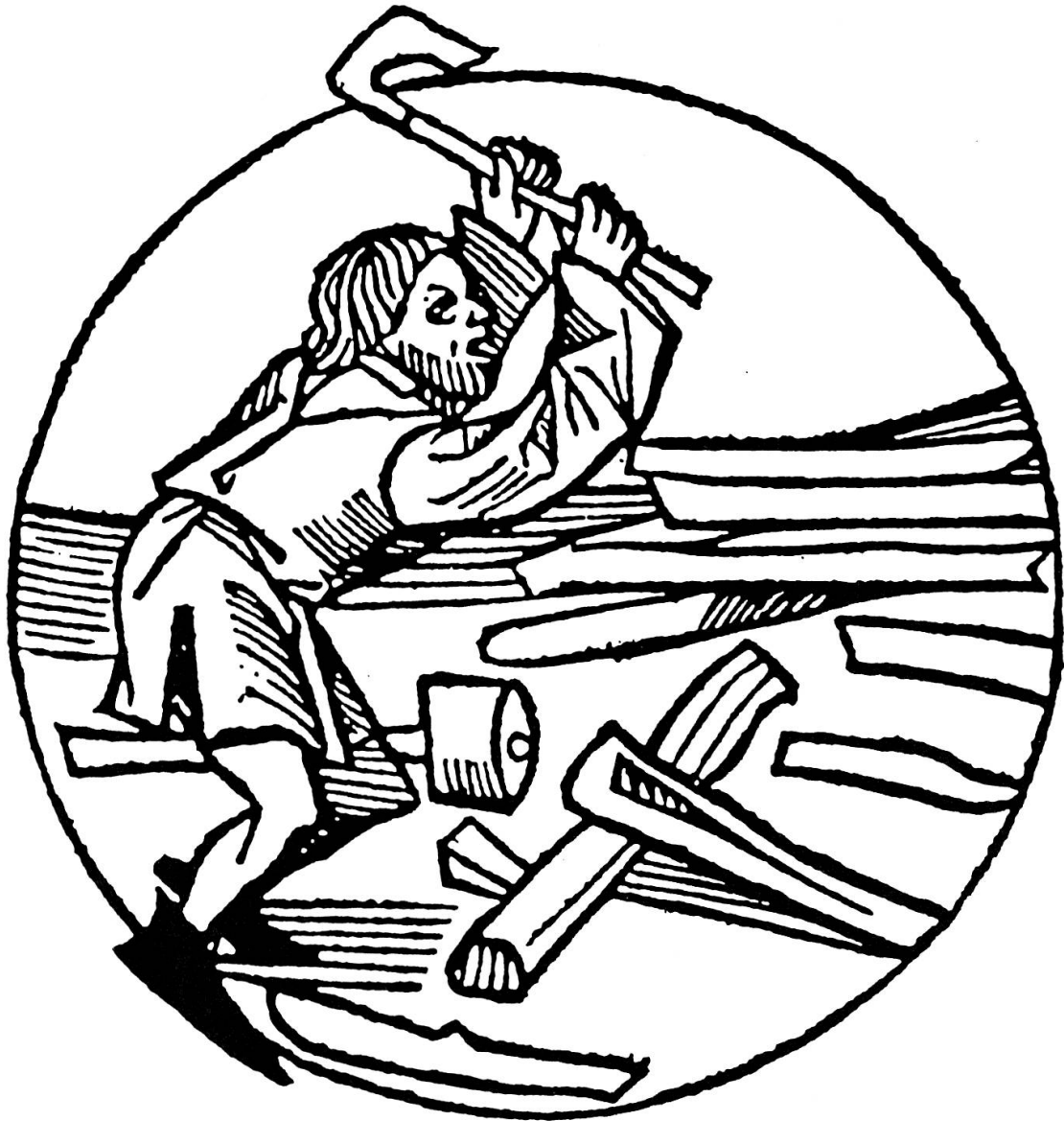
Abb. 3. Dem Holzhunger der Städte mit ihren vielfältigen Gewerben, den Schmelzöfen und den Salzsiedereien fielen die Wälder ganzer Landstriche zum Opfer, so dass schliesslich das Erstellen von Holzzäunen und das Dachdecken mit Schindeln verboten werden musste (Kalender von Hans Schönsperger, um 1490).

Verdienst durch Erweiterung des zahlenden Personenkreises zu steigern. In Gerolzhofen mussten seit 1543 Kinder mit 9 und 10 Jahren Badgeld bezahlen, seit 1557 auch Kleinkinder, die ins Bad getragen wurden 87 . Eine weitere Variante des Geldeinsparens finden wir in Hallstadt. Als der Bader 1622 um Erhöhung des Badgeldes bat, erliess ihm die Obrigkeit stattdessen den Bestandzins (Pacht) 88 .