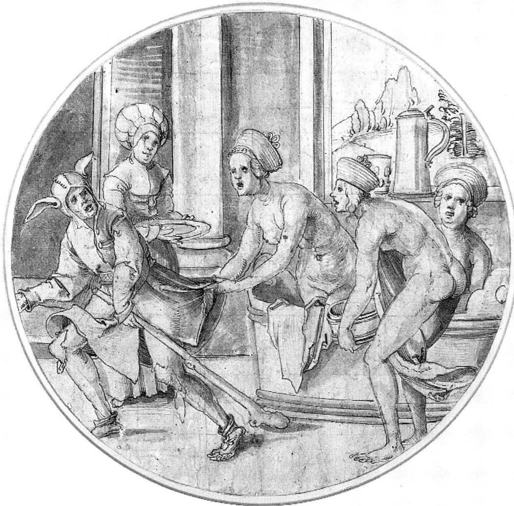
Abb. 1. Gelegentliche Exzesse brachten die Badestuben in Verruf und bestärkten die Vorurteile gegen die Bader und ihre Bediensteten. Hans von Kulmbach: Frauenbad mit Narren, 1511–1517 (Städelsches Kunstinstitut in Frankfurt am Main).