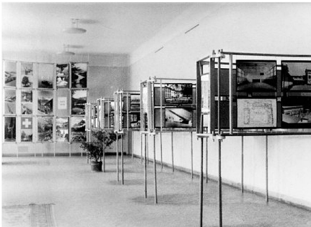
In der Ausstellung «Schweizer Architektur und Urbanismus» in der Moderna galerija, 1951.

In Ljubljana fanden Ausstellungen über die Architektur in der Schweiz Anfang der fünfziger Jahre in regelmässiger Folge statt. Auf Grund der vorzüglichen Kontakte zwischen den slowenischen und schweizerischen Architekten wurde dem Architekturgeschehen in der Schweiz in der Zeitschrift Arhitekt besondere Aufmerksamkeit gewidmet. Das Magazin veröffentlichte Beiträge und Besprechungen von Werken schweizerischer Architekten 8 sowie Rezensionen von Architekturbüchern, die in der Schweiz erschienen 9 . So berichtete die Zeitschrift Arhitekt 1951/1 10 ausführlich über die Ausstellung «Schweizer Architektur und Urbanismus» Ende Februar 1951 in der Moderna galerija in Ljubljana. Der Architekt Ljubo Humek veröffentlichte kurz darauf in Arhitekt 1952/6, S. 36–38 einen Bericht über eine Reise durch die Schweiz, Schweden und Finnland. Vom 16. März bis 10. April 1952 war in der Moderna galerija in Ljubljana eine Ausstellung über das schweizerische Plakat zu sehen. Etwa ein Jahr später, vom 8. bis 19. Mai 1953, folgte ebenfalls in der Moderna galerija eine Ausstellung über Le Corbusier. Vom 21. Februar bis 9. März 1954 zeigte dieselbe Institution die Ausstellung «Von der alten zur neuen Schule». Im Rahmen dieser Schau wurde eine Enquête über den zeitgemässen Schulbau durchgeführt, an der Alfred Roth mitwirkte. Die Nummer 1954/12 der Zeitschrift Arhitekt war ganz dieser Problematik gewidmet.