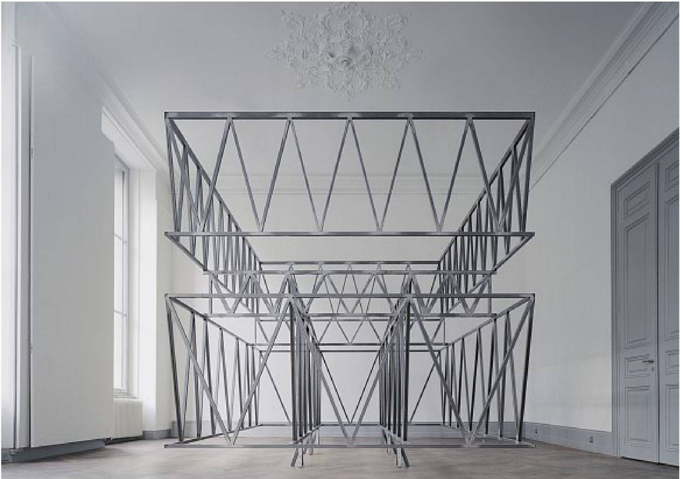
Modell der Tragstruktur vom Schulhaus Leutschenbach, Zürich, im Schweizerischen Architekturmuseum Basel 2006.

tonische Absicht verstehen, um gezielt Lösungen zu konzipieren, die diese unterstützen. Im Gegenzug muss der Architekt die Grenzen des Ingenieurs spüren und diese auch als Potenzial des Weitergehens begreifen. Im Idealfall schaukeln sich architektonische und technische Vorstellungen gegenseitig hoch und der Entwurf wird dadurch gesteigert. Der andere entscheidende Punkt ist für mich das Interesse für die Ausführung selbst: Wie wird ein Konzept in etwas real Gebautes umgesetzt. Man sollte nicht bei der Konzeption stehen bleiben, sondern auch die Ausführung selber betreuen. Das schliesst beispielsweise auch die Kommunikation mit dem Polier ein, der sich, wenn er miteinbezogen wird, durchaus auch für eine komplizierte aber ausgeklügelte Lösung begeistern lässt.