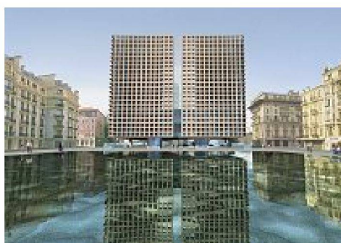
Aurelio Muttoni und Livio Vacchini, Verwaltungszentrum in Nizza, Wettbewerb 1999–2001.