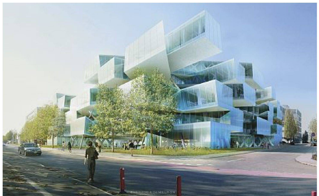
WGG Schnetzer Puskas Ingenieure und Herzog & de Meuron, Actelion-Headquarter in Allschwil. – Visualisierung: Herzog & de Meuron Architekten; Baustellenbilder: Johannes Marburg/WGG Schnetzer Puskas Ingenieure

neu entwickelten Recycling-Leichtbetons konnten die Lasten unter Kontrolle gebracht werden.