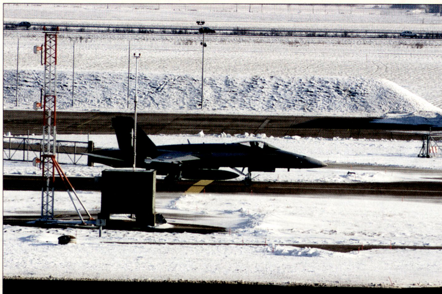
La base aérienne est la clé de voûte des opérations.

Par ailleurs selon les principes mêmes du concept, la BA doit pouvoir fonctionner et fournir les prestations exigées en toute situation. Donc la planification et la conduite des opérations devraient être semblables sinon identiques en toute circonstance, avec ou sans renforcement par la milice.