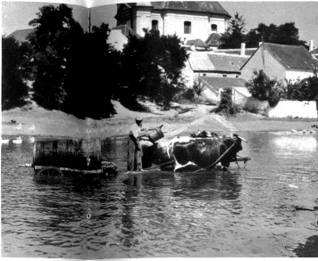
Dorfteich in der Slowakei