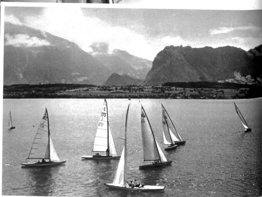
Segelregatta auf dem Thunersee. Spannender Kampf der 30m 2 Yachten