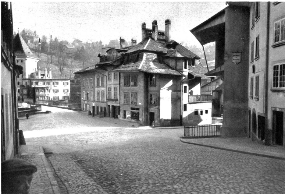
Blick auf die Felsenburg, den ehemaligen Bluturm. — Beim untersten Hause des Staldens, rechts im Bilde, ist der Kugelschuss, der im Stecklikrieg ein Loch in die Hausmauer riss, sichtbar.

bietet dem Maler Hunderte der reizendsten Motive. Interessant aber ist sie ganz besonders dem Historiker. Das Kaufhaus, wohl No. 10, diente einstmals dem Schloß Nydegg als Waren-