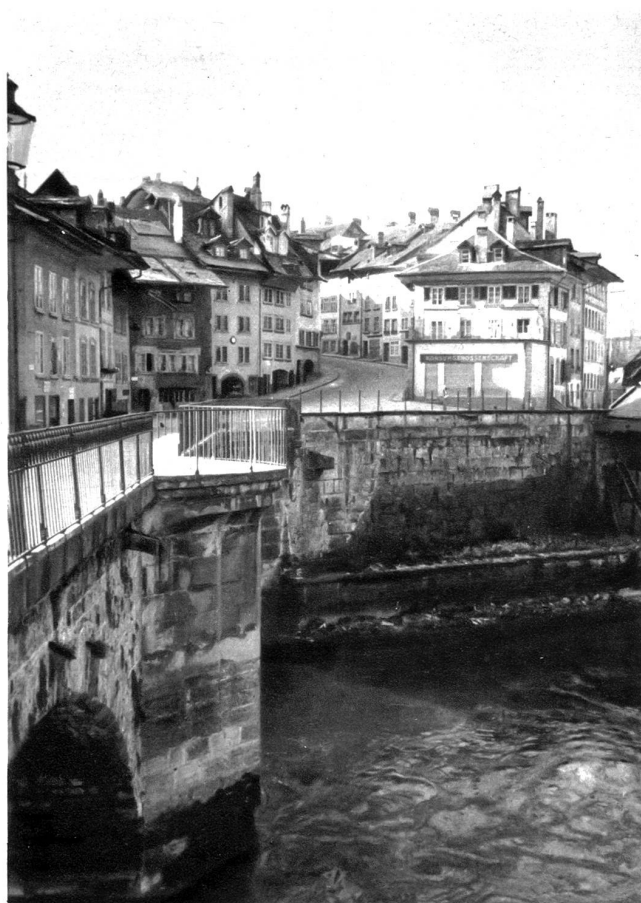
Nydegghbrücke mit Läuferplatz und Stalden

lager. Noch ist eine Kaufhausordnung aus dem Jahre 1373 bekannt. Die Häuser, die sich dem ehemaligen Kaufhaus anschließen, zeigen noch die Bauart des frühesten Mittelalters: enge Hauseingänge, schmale Treppen, damit das Haus besser verteidigt werden kann, sowie die großen Stuben mit den breiten Fenstern im obersten Stockwerk; hier pflegten die Frauen zu spinnen und zu weben. In dieser Häuserreihe befindet sich die zeitlich erste Wirtschaft der Stadt Bern.