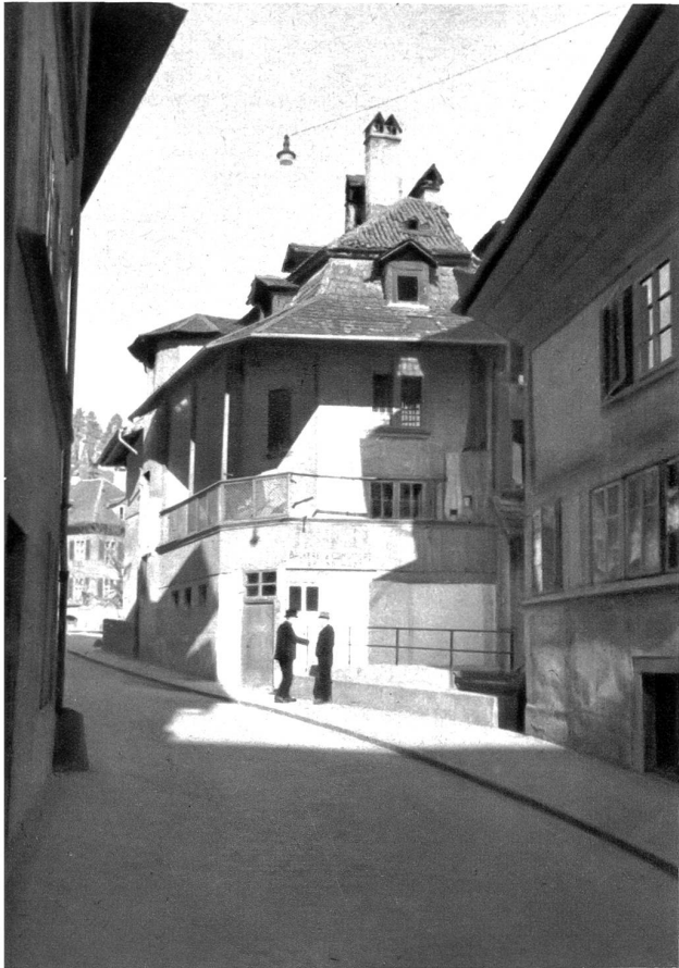
berer Teil des Ramseyerloches

Im dem Hofe, der sich hier bildete, ist noch das Gebäude zu sehen, das den Chorgerichten als Gefangenschaft diente. Der erste Gefangene soll dem Ramseyerloch seinen Namen gegeben haben. Zum Interessantesten gehört das alte Stadttor, in dessen einem Teile nunmehr eine Schusterwerkstatt als im Boden liegt. Durch dieses Tor, das durch drei Meter hohe Mauern ging, ritten und schritten einstmals Könige, Kaiser und Päpste. 272 Jahre hindurch diente es als Stadttor. Im vorigen Jahrhundert wurde es von seinem Eigentümer zur