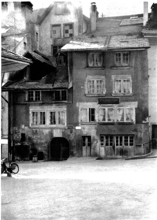
Der „Burger Hus“ mit der alten Schmiede. Darüber sind Häuschen des Nydegghöflis sichtbar