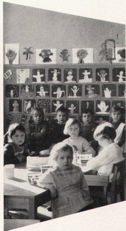
Mobiliar für Kindergärten

mit der 10-Jahres-Garantie für dauerhaften Schreibbelag und den Vorteilen: Angenehmes, weiches, blendungsfreies Schreiben und Zeichnen auf graugrün und schattenschwarzen, magnethaftenden und kratzfesten Flächen, die leicht zu reinigen sind.