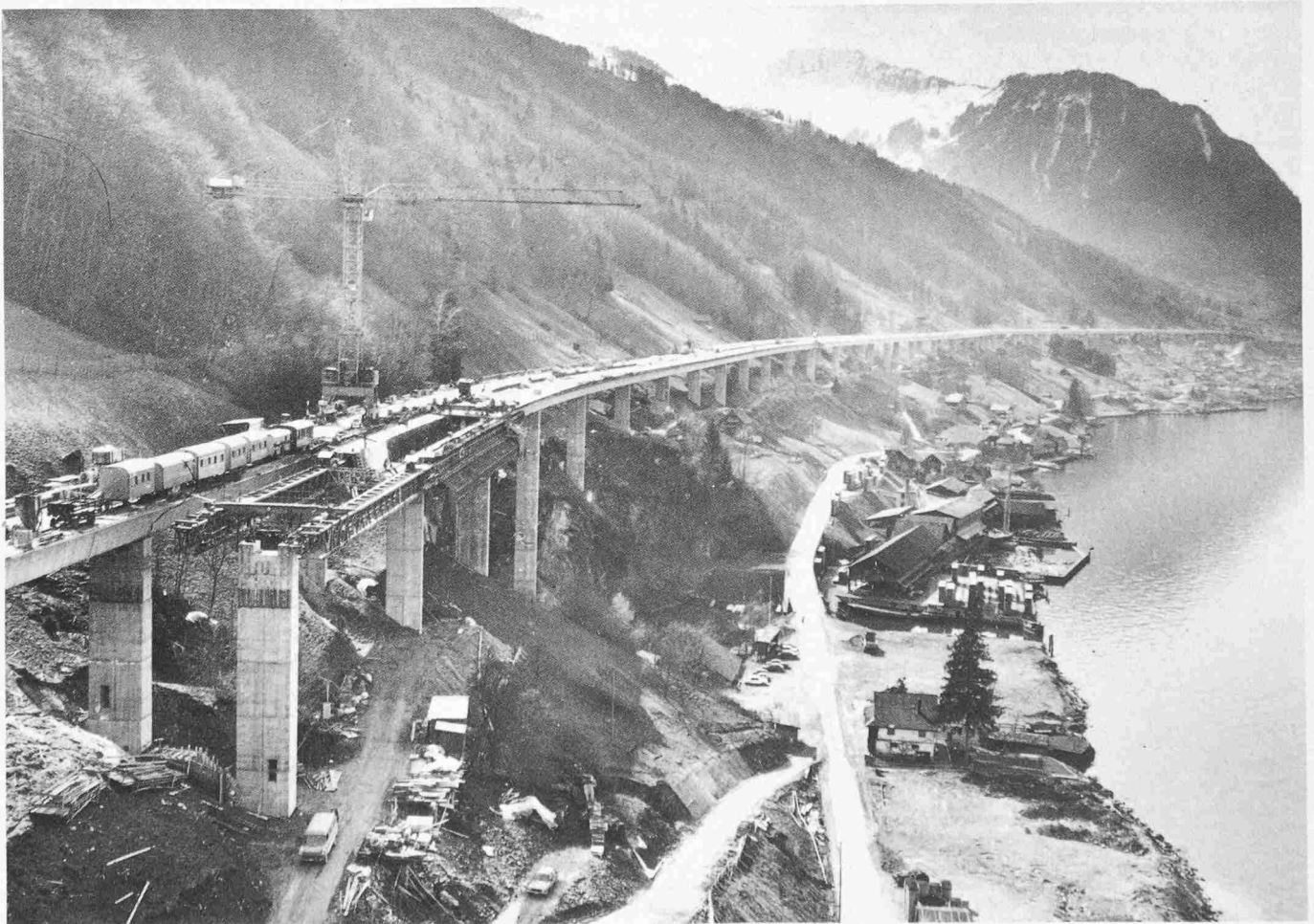
Lehnviadukt Beckenried. Ende Mai 80. Die bergseitige Brücke hat das Nordportal des Seelisbergtunnels erreicht. Blick vom Nordportal Richtung Beckenried