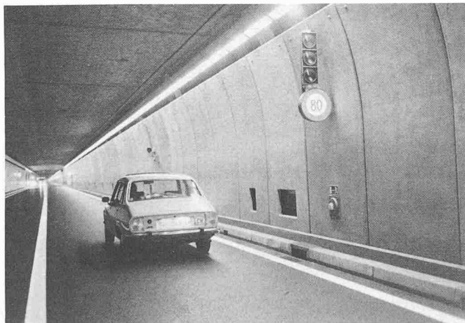
Bild 2. Beleuchtung der Mittelzone

Obwohl der Gotthard-Strassentunnel mit einer äusserst zuverlässigen Energieversorgung ausgestattet ist, muss mit zeitweiligen Spannungsunterbrüchen gerechnet werden. Sie können sowohl den ganzen Tunnel umfassen, als auch partiell , infolge eines Defektes in der tunnelinternen Verteilung, auftreten. Diese Unterbrüche bewirken einen Ausfall der Tunnelbeleuchtung und damit verbunden eine plötzliche Reduktion der Sichtweite. Bei einem Fahrzeuglenker kann dies zu Fehlreaktionen und als Folge davon zu einem Unfall führen. Nebst Fahrzeugen, die wenigstens mit einer eigenen Beleuchtung ausgestattet sind, die bei der Durchfahrt eingeschaltet ist, muss im Tunnel mit Fussgängern ( Pannenfahrzeuge ) gerechnet werden. Um diese Gefahrenquellen auszuschalten, ist der Tunnel mit einer Notbeleuchtung versehen. Sie ist in die Normalbeleuchtung integriert, so dass keine speziellen Notleuchten installiert werden mussten. Jede zehnte Leuchte der Fluoreszenzbeleuchtung wird dauernd von einem Wechselrichter gespeist. Bei vorhandenem Netz erhält der Wechselrich-