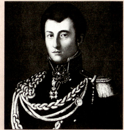
General Carl v. Clausewitz, Stabschef in verschiedenen Verwendungen in Preussen und Russland (hier in russischer Uniform). Klassiker unter den Militärdenkern.

Napoleon überdehnte seine Nachschubwege und musste sich schliesslich aus Moskau zurückziehen. Der Russlandfeldzug kostete ihn eine ganze Armee von über