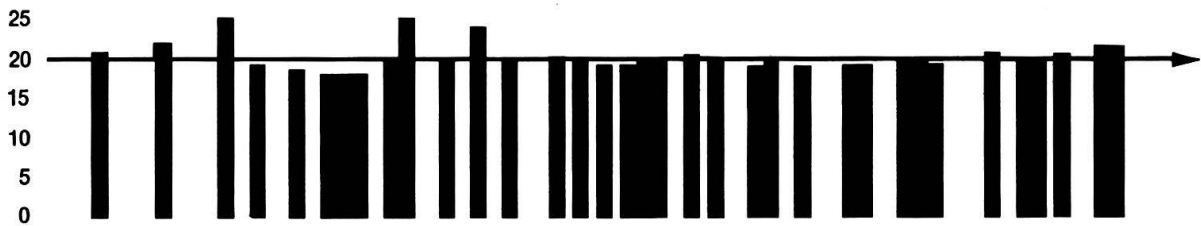
Fig. 2 bis