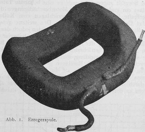
Abb. 1. Erregerspule.