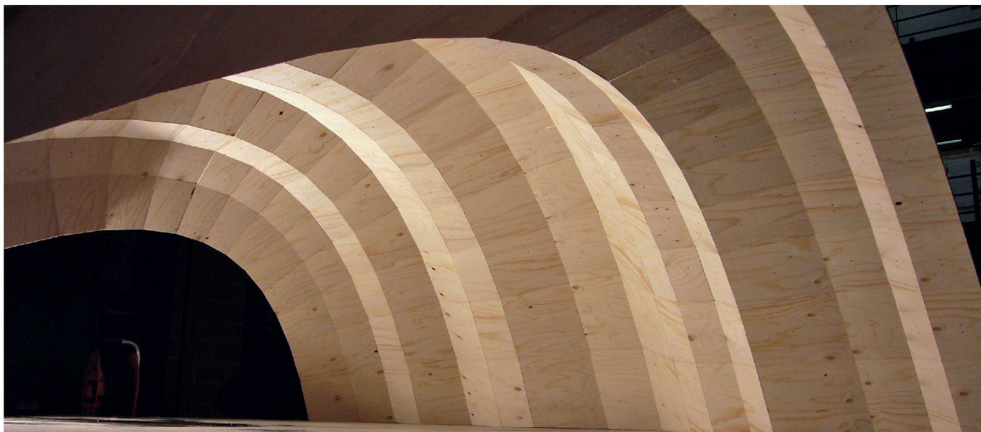
01 Holz in neuen Formen – dank digitalen Planungs- und Fabrikationstechnologien zu vertretbaren Kosten

Die handwerkliche Bearbeitung von Holz wird durch neue Methoden ergänzt und abgelöst. Holz ist zum Hightech-Material mutiert: Es lässt sich schweißen, falten und verformen und verbindet sich mit anderen Baustoffen. Die Ausstellung «Timber Project» an der EPFL zeigt zukunftsweisende Wege, die seit 2004 am Lehrstuhl IBOIS erforscht werden.