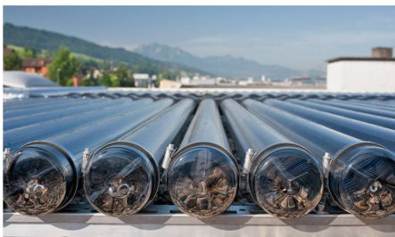
04 Kategorie Anlagen: solarthermische Kerzen- fabrikation, Root