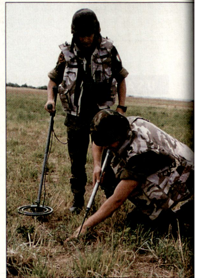
Die Minenräumung durch zivile und militärische Räumungsspezialisten kommt nur sehr langsam voran.

Die deutsche Bundesregierung unterstützt das Minenräumen in Afghanistan erneut mit einem Beitrag von 2,8 Mio. Euro. Seit 1995 hat die Bundesregierung gemäss eigener Angaben insgesamt 27 Mio. Euro für das humanitäre Minenräumen in Afghanistan eingesetzt. Unterdessen musste Anfang Juni 2005 einmal mehr das Minenräumen aus Sicherheits-