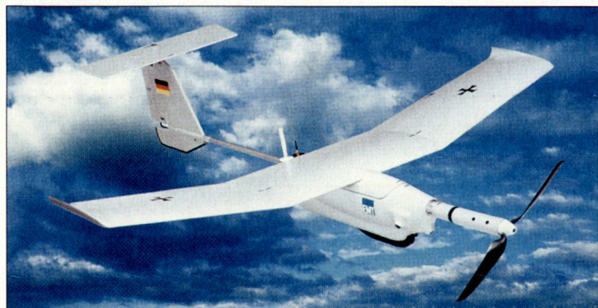
Die elektronisch angetriebene Minidrohne «Aladin» soll v.a. bei Auslandseinsätzen zum Einsatz gelangen.

Im Drohnensystem «Aladin» steckt unterdessen die Erfahrung aus über 400 Einsatzflügen, die vom deutschen Heer im Einsatz in Afghanistan und bei anderen Missionen mit Vorseriensystemen vorgenommen wurden. Die Erprobung und Testflüge erfolgten zum Teil unter widrigen Wetterverhältnissen und in schwierigem resp. völlig fremden Gelände. «Aladin» ist die kosteneffiziente Lösung für eine rasche und flexible Luftaufklärung im Nächstbereich und dient bei künftigen Auslandseinsätzen in Krisenregionen v. a. zur Gewährleistung der «force protection». hg