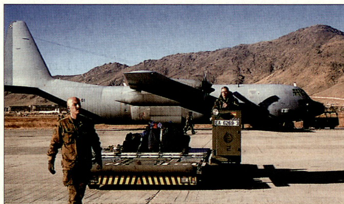
Spanische Transportmaschine C-130 «Hercules» auf dem Flugplatz Termes.

Deutschland plant gemäss Aussagen des Verteidigungsministeriums eine Aufstockung des Kontingents von derzeit 2250 auf 3000 Soldaten. Die Erhöhung soll zusammen mit einem neuen Mandat diesen Herbst wirksam werden; allerdings muss dies der Bundestag noch bestätigen. Deutschland und Spanien haben in diesem Sommer eine engere Kooperation ihrer Kontingente in Afghanistan vereinbart. Spanien stellt dabei der Bundeswehr für den Transport von Truppen und Material nach den von Deutschland geführten PRTs in Kundus und Faisabad freie Lufttransportkapazitäten zur Verfügung. Im Gegenzug wird Spanien den von Deutschland genutzten Flugplatz in Termes anfliegen. Trotz der unsicheren Lage in Zentralasien will man weiterhin diesen usbekischen Luftstützpunkt benutzen. Die deutsche Bundeswehr will in nächster Zeit generell die Auslandseinsätze ausweiten. Deutschland beabsichtigt dabei, vermehrt auch an friedenserzwingenden Einsätzen teilzunehmen. Deutsche Soldaten sollen gemäss Aussagen der Heeresführung künftig in der Lage sein, weltweit