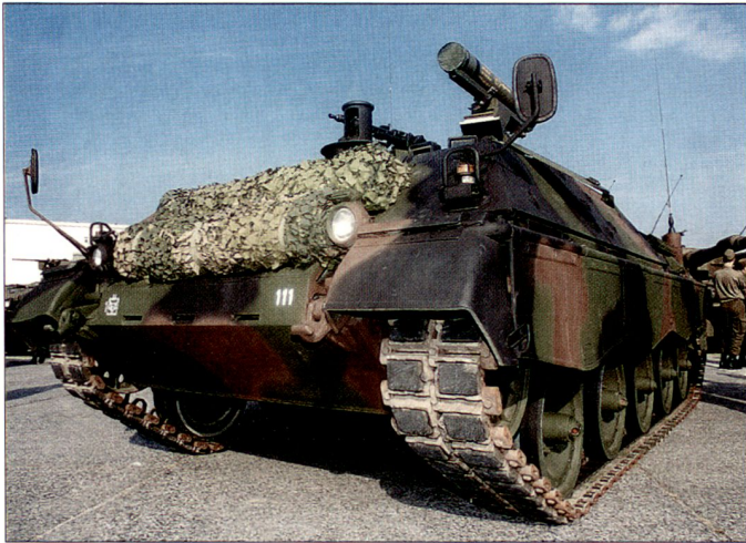
Auch Österreich will einen Teil der veralteten schweren Waffen (Bild: Jagdpanzer «Jaguar») verkaufen resp. verschrotten.

für Verbesserungen im Alltag der Soldaten eingesetzt werden. Darüber hinaus soll auch der gesamte Erlös aus dem Verkauf von Liegenschaften den Investitionen zugute kommen. Gleichzeitig ist auch der Verkauf von überschüssigen Waffensystemen vorgesehen.