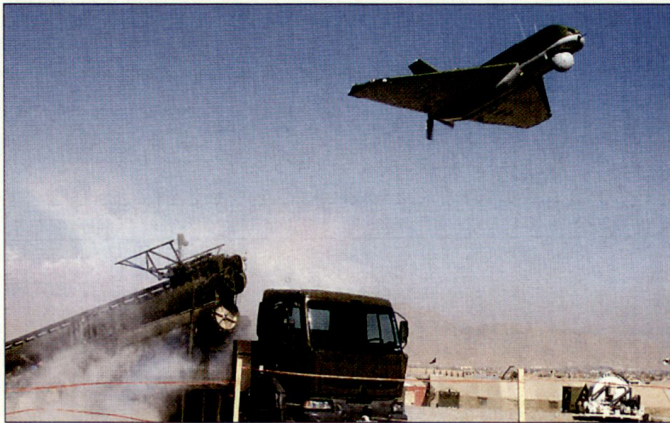
Bei der ISAF in Afghanistan stehen auch diverse Drohnensysteme im Einsatz. Im Bild das kanadische UAV «Sperwer».

Nach den fünf PRTs im Norden wird die NATO im Verlaufe dieses Jahres weitere vier Aufbauteamen im Westen Afghanistans übernehmen und dadurch den Verantwortungsbereich wesentlich ausdehnen. Im Frühjahr 2006 sollen mit der Umsetzung der Stufe 3 auch PRTs im Süden des Landes übernommen werden.