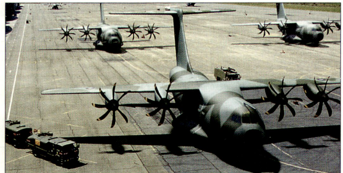
Zukünftiges europäisches Transportflugzeug A-400M.

Allerdings ist weiterhin fraglich, ob diese geplanten Beschaffungen in den einzelnen Staaten zeitgerecht erfolgen und vollumfänglich finanziert werden können. hg