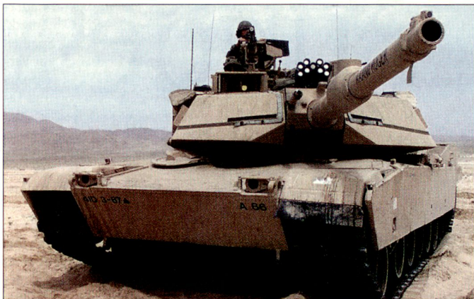
Der M1A2 «Abrams» ist der modernste Kampfpanzer der US Army.

Nach einem bisher erkennbaren, schwergewichtigen Einsatz der ISAF im Raume Kabul wird nun eine stufenweise Ausweitung des ISAF-Mandats – mit so genannten PRTs (Provincial Reconstruction Teams) – auf die Provinzen des Landes angestrebt.