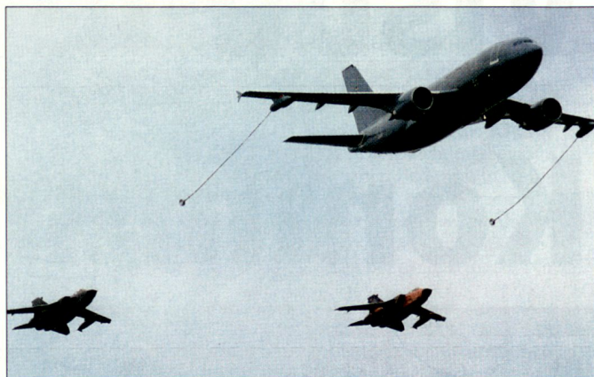
Auch die deutsche Bundeswehr schafft eigene Fähigkeiten zur Luftbetankung.

Mit der Verbindung von Langstreckentransport und Luftbetankung beschreitet die Deutsche