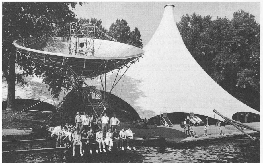
Grosser Sonnenkollektor mit seinen Erbauern. Sarna Zeltbau

Im Bereich «Wasser» (Hydraulik und Strömungslehre) finden sich neben antiken bis modernen Wasserspielen Wirbeleffekte und