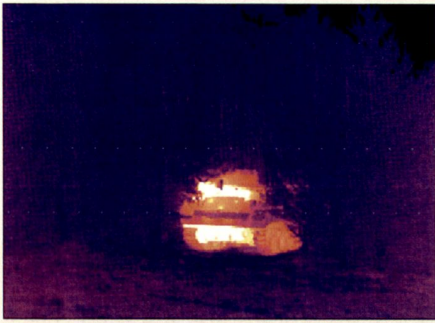
Wärmebildaufnahme (8–12 \mu m) von M113 ungetarnt in einer Waldlichtung.