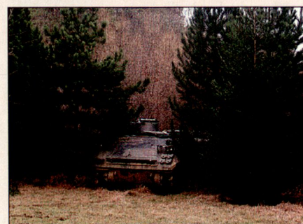
Ein M113 ungetarnt in einer Waldlichtung.

Die multispektrale Tarnung ist vor allem für Länder, die wie die Schweiz nicht a priori auf eine hohe Luftüberlegenheit zählen können und sich trotzdem gegen Aufklärung durch Satelliten, Flugzeuge und Drohnen schützen wollen, von grosser Bedeutung. Tarnung ist ein Schlüssel, um die Überlebensdauer von kostspieligen und komplexen Anlagen und Systemen signifikant zu erhöhen, ein Schlüssel zudem, dessen Kosten im Vergleich zu denjenigen der zu schützenden Objekte nur einen geringen Bruchteil ausmachen.