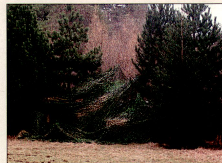
Ein M113 mit Tarnnetz in einer Waldlichtung.

In Europa wird der multispektralen Tarnung deshalb von wehrwissenschaftlicher Seite viel theoretisches Interesse entgegengebracht. Dieses Interesse mündet jedoch erst wenig in konkrete Beschaffungsentscheidungen. Im Rahmen der Beurteilung durch verschiedene internationale wehrwissenschaftliche Gremien in multinationalen Messkampagnen, durchgeführt durch Truppen der jeweiligen Länder und deren Fachabteilungen in den Beschaffungsämtern, zeigt sich regelmässig, dass das in der Schweiz entwickelte Tarnmaterial leistungsmässig an der Spitze steht. Das durch Auftragen mehrerer unterschiedlicher, dünner Schichten aufgebaute textile Material trägt den verschiedenen Erkennungssensoren in den spezifischen Wellenlängenbereichen Rechnung. Einerseits ist das Material dank einer patentierten wellen-