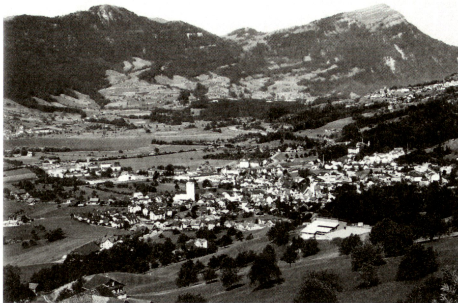
Steinen heute, Aufnahme von der Schlagstrasse zwischen Schwyz und Sattel.

Über die Ursache der verschiedenen Dislokationen wurden innerhalb der Truppe die wildesten Gerüchte herumgeboten.