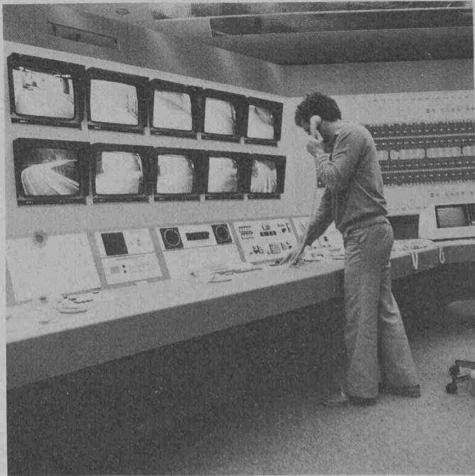
Bildinformationen aus Tunnel und Portalzonen für das Bedienungspersonal