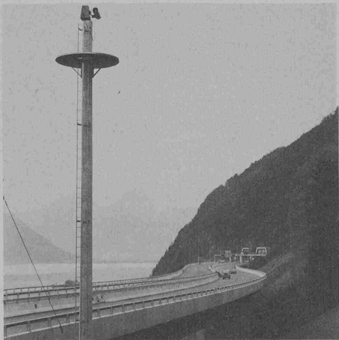
Vollbewegliche Mastenkamera. Sie steht nördlich des Tunnels und überblickt einen grossen Teil des Lehnenviaduktes

Die Übertragung der Bildsignale erfolgt über paarsymmetrische Leitungen, wobei je Kabel über die gesamte Strecke eine Bandbreite von 5 MHz ausgenutzt wird. Für die Steuerung und Signalaufbereitung sind sieben Unterzentralen im Tunnelbereich untergebracht. Acht weitere Zwischenverstärker befinden sich auf den Strecken zu den Kommandoräumen Flüelen und Stans, welche 5 km bzw. 10 km von den Tunnelportalen entfernt sind. Gleichzeitig können