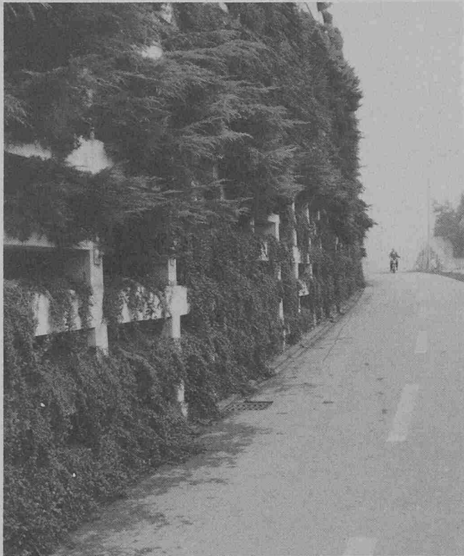
Felsverkleidung an der Eschenbachstrasse in Rüti (ZH)

kende Pflanzen und Sträucher des Lokalstandortes verwendet. Erfahrungswerte über den Aufwand für den Unterhalt der Bepflanzung, werden an ausgeführten Objekten laufend ausgewertet. Diese Auswertungen zeigen, dass die Auswahl der Pflanzen von entscheidender Bedeutung ist für den Arbeitsaufwand des Unterhaltes.