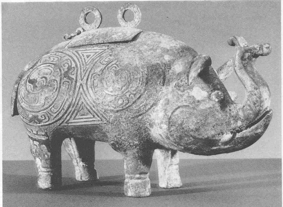
Zun in Gestalt eines Elefanten, westliche Zhou-Dynastie, 10. Jahrhundert v. Chr., Bronze

Die Ausstellung wurde in kollegialer Zusammenarbeit von Helmut Brinker, Professor an der Universität Zürich und Konservator der Ostasien-Abteilung des Rietbergmuseums in