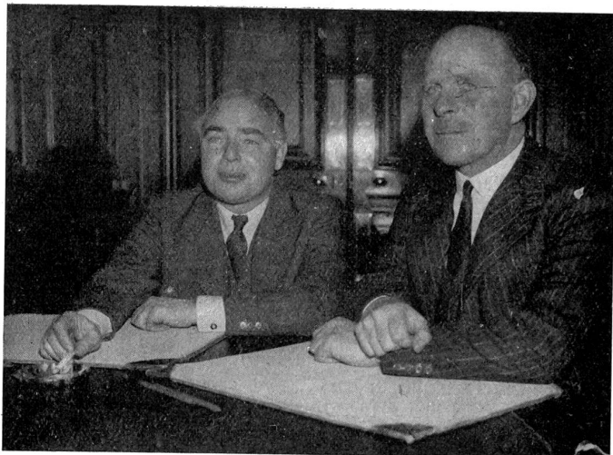
London. Mr. Hore-Belisha, Englands jugendlicher Kriegsminister (er ist 43 Jahre alt), nahm eine drastische Veränderung in der obersten militärischen Leitung der britischen Armee vor. Er ernannte den 53jährigen Generalmajor Viscount Gort zum Chef des Generalstabschefs anstelle des bisherigen Leiters, Feldmarschall Sir Cyril Deverell, der 64 Jahre alt war. Auch andere bedeutende Positionen in der Heeresleitung wurden an wesentlich jüngere Generäle übergeben. Unser Bild zeigt Mr. Hore-Belisha mit Generalmajor Gort, am 3. Dezember im Kriegsministerium Whitehall, nach der Bekanntgabe der Ernennung.