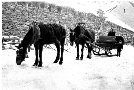
Die Simplonpost in Gstein-Gabi, 1232 m