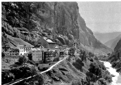
Gondo, Zwischbergen, südl. des Simplon, Wallis, 860 m