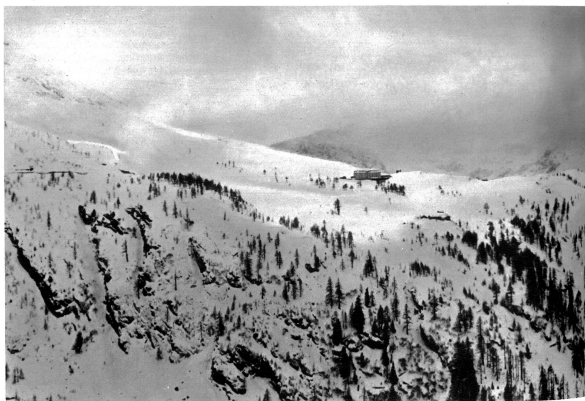
Blick auf den Simplonpass

Von Gondo fährt der Postwagen noch etwa einen Kilometer durch die von Eisstriften glühende Schlucht, dann steigen die Reisenden in den in der Schlucht bereitstehenden Schlitten