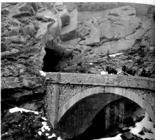
Die Simplonpost auf der Brücke über dem Frassinone-Wasserfall, 1047 m, am Ausgang der 222 m langen Gondogalerie

ganze vier Monate keine Sonne hat. Das nächste schneeigefüllte Dorf Gondo-Zwischbergen bingegen hat sogar am kürzesten Tage zwanzig Minuten Sonnencheinbauer.