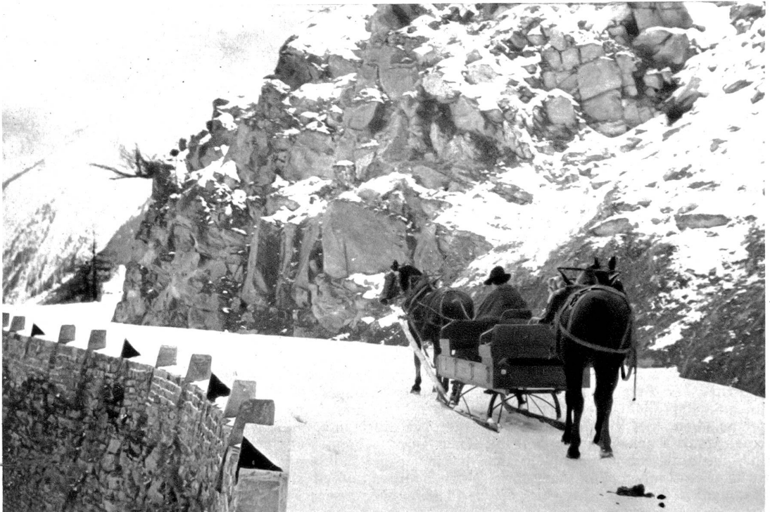
Nordwärts zieht die Simplon- post

Der Postwagen (ein alter Gotthard-Postwagen) verläßt morgens sieben Uhr Iffelle, die erste Station auf der Südseite des Simplontunnels und durchfährt in einer Stunde die Gondoschlucht bis Gondo. Unterhalb des Dörfchens passiert er die Schweizergrenze. Der Reisende kommt auf dieser etwas holperigen Reise nur am italienischen Dorfe Iffelle vorbei, das im Winter