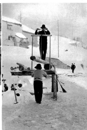
Beim Balkensägen im Simplondorf

In Simplon-Dorf kann man sich eine halbe Stunde lang wärmen und etwas essen. Unterdessen werden die Postkutsche