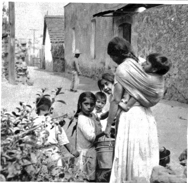
Indiofrau mit Kindern. Scheu blicken die Kleinen in die Kamera