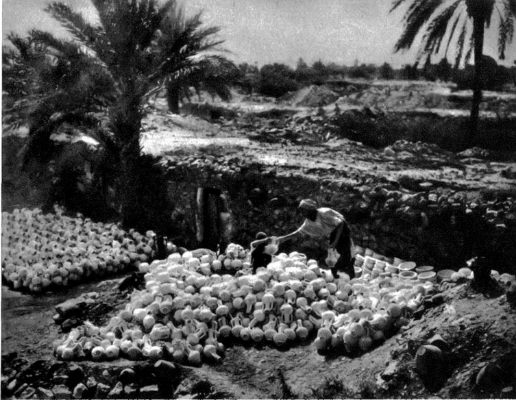
Ein Brennofen umfasst viele Hundert Töpfe