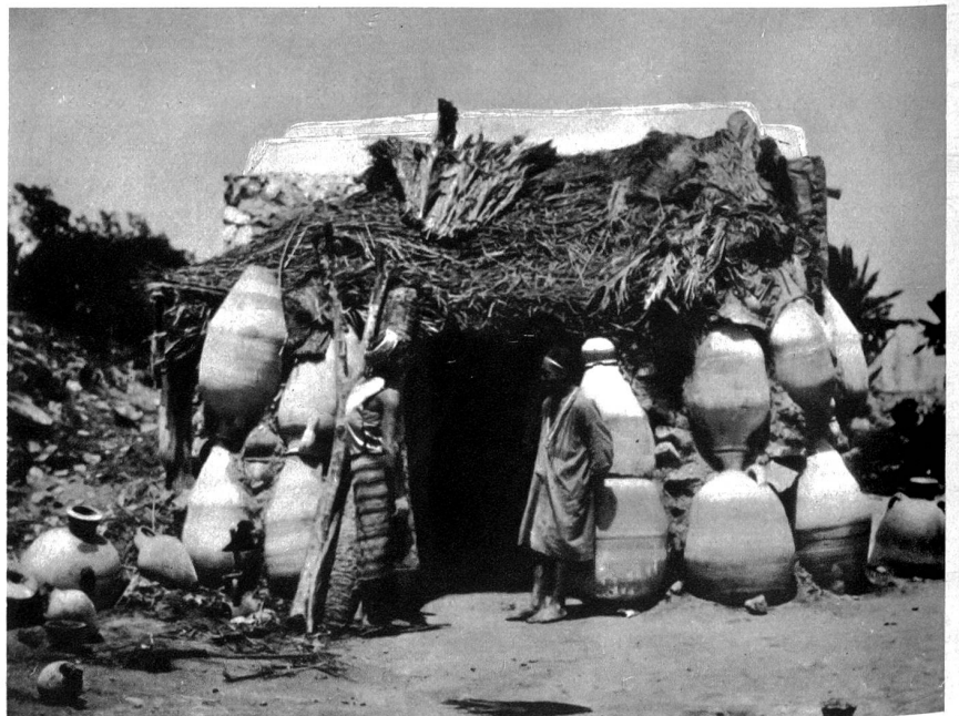
Die Töpfer verwenden zum Hausbau zerbrochene Töpfe