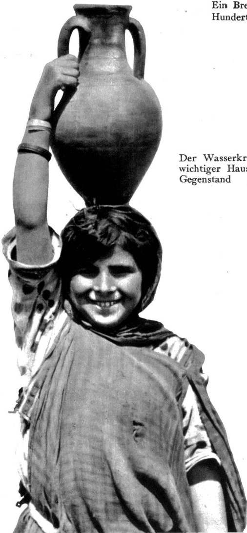
Der Wasserkrug, ein wichtiger Haushaltsgegenstand