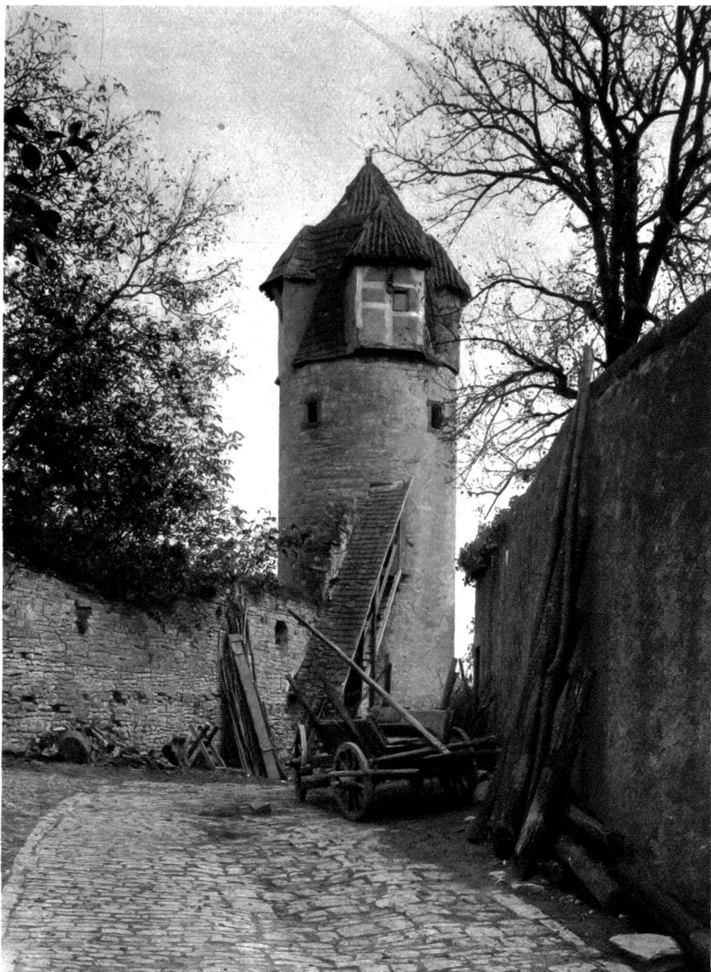
Alter Befestigungsturm in Sulzfeld am Main, baulich bemerkenswert durch die aus der Haube vorspringenden Erkerbauten

Ueberbleibsel alter, wirklich allgemeiner Volkskunst uns mehr lehrt und zeigt, als das beste Museum in der Lage ist, es zu tun. Aber sicherlich hat man sich damals auch Zeit genommen, oft und gern beim Dämmerstumpfen mit dem Baumeister, dem Nachbarn oder sonstigen Persönlichkeiten alle Einzelheiten der Pläne zu besprechen, und manch Schöpplerin „Eckendorfer Lump“ oder „Sommeracher Rabenkopf“, vielleicht auch ein „Küchenmeister“ mußte dran geglaubt haben, bis dann die „Leisten“ an die Reihe kamen. Wie heißt es doch heute im Liedchen: